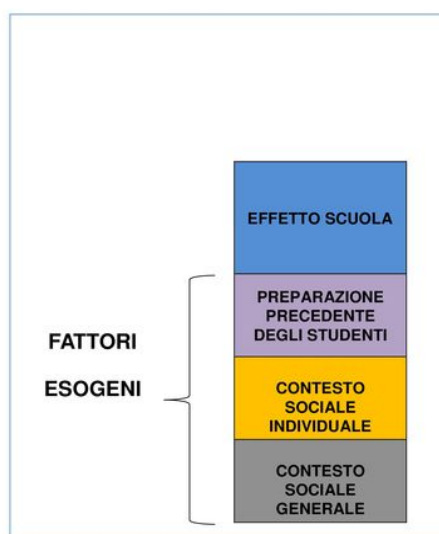
Figura 1. Composizione dei risultati di una prova

2. una parte determinata dall'effetto scuola, ossia dall'insieme delle azioni poste in essere dalla scuola per la promozione degli apprendimenti (scelte didattico-metodologiche, organizzazione della scuola, ecc.).