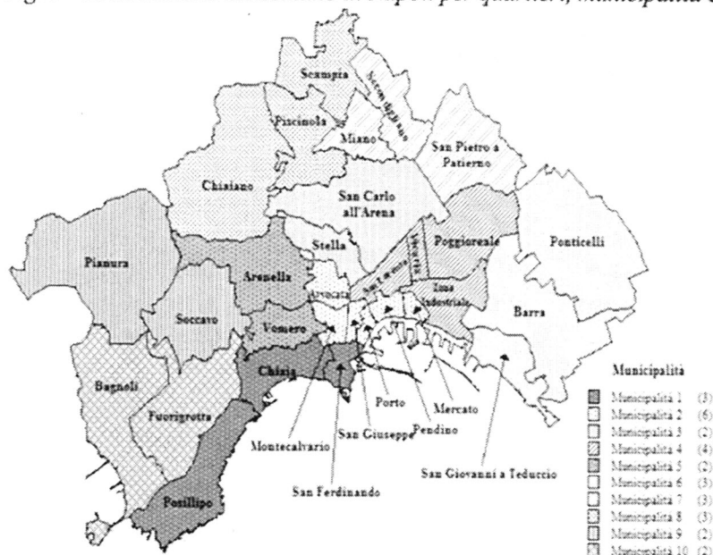
Fig. 1 – Articolazione del comune di Napoli per quartieri, municipalità e macro-aree

Nota: Centro storico = Chiaia, San Ferdinando, Mercato, Pendino, Avvocata, Montecalvario, Porto, San Giuseppe, San Carlo all'Arena, Stella, San Lorenzo e Vicaria; Collina = Vomero e Arenella; Est = Poggioreale, Zona industriale, Ponticelli, Barra e San Giovanni a Teduccio; Nord = Miano, Secondigliano, San Pietro a Patierno, Piscinola, Chiaiano e Scampia; Ovest = Posillipo, Soccavo, Pianura, Bagnoli e Fuorigrotta.