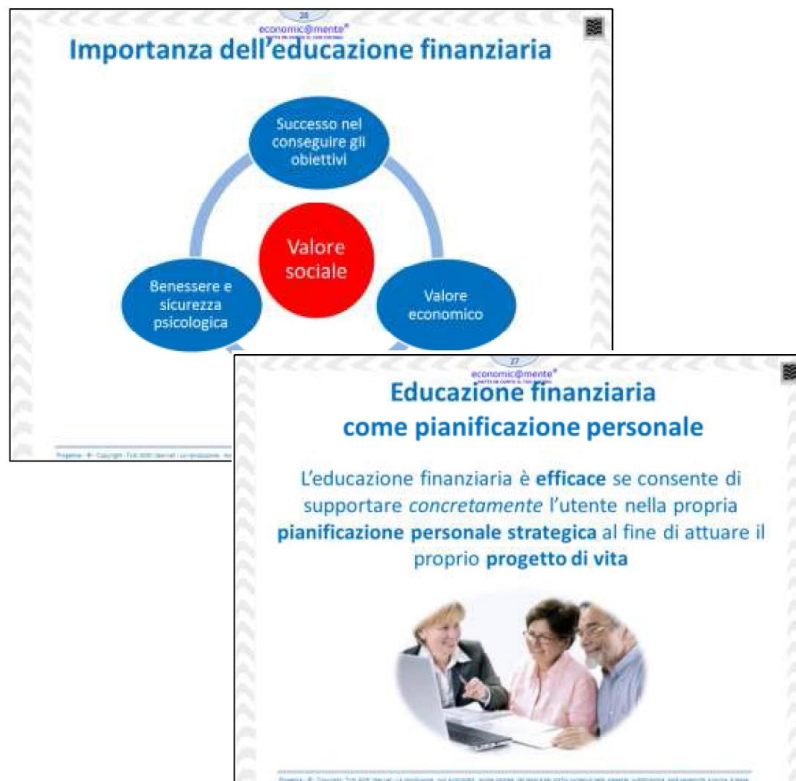
Modulo 4. Slide 26-27 L'importanza dell'educazione finanziaria e le condizioni per la sua efficacia.